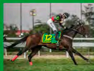
1º COPA CLÁSSICA – G1